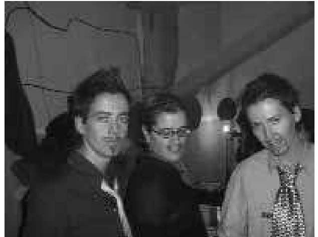
Fiesta-taller Drag-king , «Noche de reyes», GtQ, Escalera Karakola, Madrid, 5 de enero, 2004.