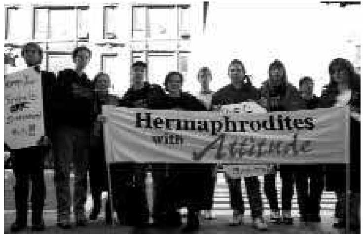
Portada de la revista Chrysalis: The Journal of Transgressive Gender Identities , 2 (5), 1997-1998.