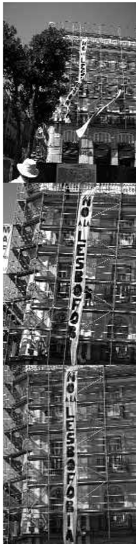
Intervención de GtQ contra la manifestación lesbófoba «la familia importa», 18 de junio, Madrid, 2005.