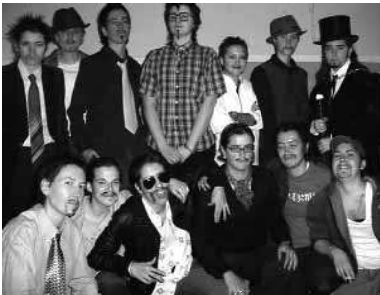
Fiesta-taller Drag-king , «Noche de reyes», GtQ, Escalera Karakola, Madrid, 5 de enero, 2004.

Las imágenes de los grupos queer sacan a la luz la pluralidad de identidades, comunidades, subculturas, cuerpos de punky femmes , transgéneros, intersexuales, drag-kings , ciborgs , FTM, 21 lesbianas maricas, etc. en los que se inscriben los cortocircuitos de la máquina heterosexual, los «fallos» en la cadena sexo biológico - género - deseo - objeto de deseo - prácticas sexuales. Frente a la idea de que la masculinidad y la feminidad son identidades sexuales originales y la homosexualidad es una imitación, una mala copia, los y las queer resignifican de manera paródica, a lo camp , estas identidades «originales».