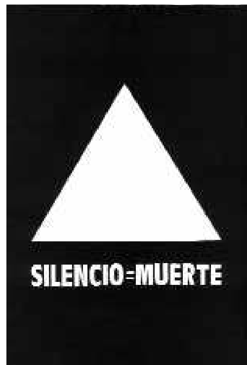
Cartel Lucha contra el SIDA, La Radical Gai, Madrid, 1992.

«Soy lesbiana sexualmente activa, hago sexo seguro, lucho contra el SIDA» Non Grata. LSD. 1995