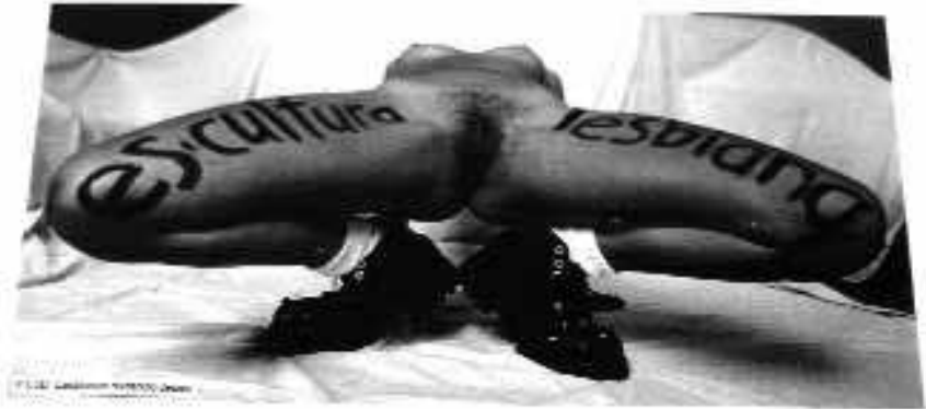
«Es-cultura Lesbiana» de la serie fotográfica «Es-cultura Lesbiana», LSD, Madrid, 1995. (Original en B/N).

El análisis está centrado, por lo tanto, no en lo que los grupos dicen (el denominado «análisis del discurso») sino en lo que los grupos hacen (las acciones y representaciones que llevan a cabo). 5 Este artículo utiliza literatura secundaria sobre la teoría y el activismo queer y el análisis de fuentes primarias (las imágenes de grupos significativos: 6 carteles, fanzines , panfletos, manifestaciones y actos que han influido o que son importantes desde el punto de vista de la representación), si bien, por cuestión de espacio, incluyo aquí sólo algunos ejemplos. Finalmente, este capítulo pretende ser una aportación al análisis de la práctica y las representaciones políticas queer , respondiendo a la necesidad existente de estudiar, archivar y reflexionar sobre la protesta queer que se viene desarrollando en el Estado español desde principios de los años noventa.