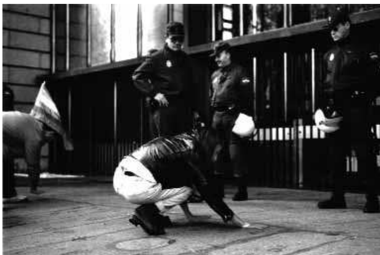
Intervención de LSD y La Radical Gai el 1 de diciembre, Día internacional de la «Lucha contra el SIDA» frente al Ministerio de Sanidad, Madrid, 1996.

No nos extrañemos entonces de que la primera investigación rigurosa sobre sida y mujeres en España, pendiente de publicación, haya venido acompañada, una vez más, de mano del activismo. Las asociaciones Creación Positiva y Ser Positivas, han promovido recientemente, desde Barcelona y Madrid, el primer estudio dirigido a recabar información sobre diferentes aspectos que afectan a las vidas de las mujeres con sida o que viven con el sida en España. El acercamiento de esta investigación según sus autoras, ha tenido como motor inicial, «(...) que uno de los principios básicos fuera que las mujeres seropositivas actuaran como sujetos activos de su propia historia, y no