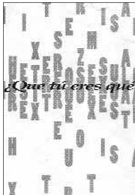
Contraportada De un Plumazo , número 5, La Radical Gai, Madrid, 1995.