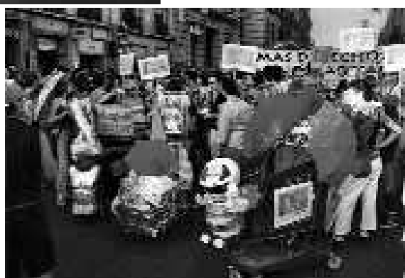
Intervención de GtQ en la manifestación del «orgullo», Madrid 2003.