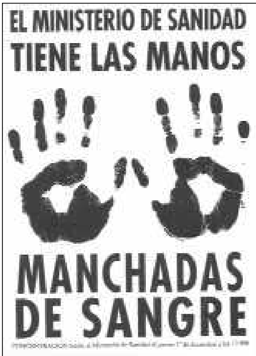
Cartel de La Radical Gai, Primero de diciembre, Día internacional de la lucha contra el SIDA, Madrid 1996.

prevención, y denunciar la pasividad de las instituciones y de grupos «gays» como el COGAM (creado en 1986), que se encontraba paralizado en una respuesta prudente: el SIDA no es más que homofobia, no hay que hacer nada. La Radical Gai, surgida de una escisión del COGAM en 1991, plantará cara a la situación ( in your face ) tal y como hicieron otros grupos como ACT UP en Nueva York o París.