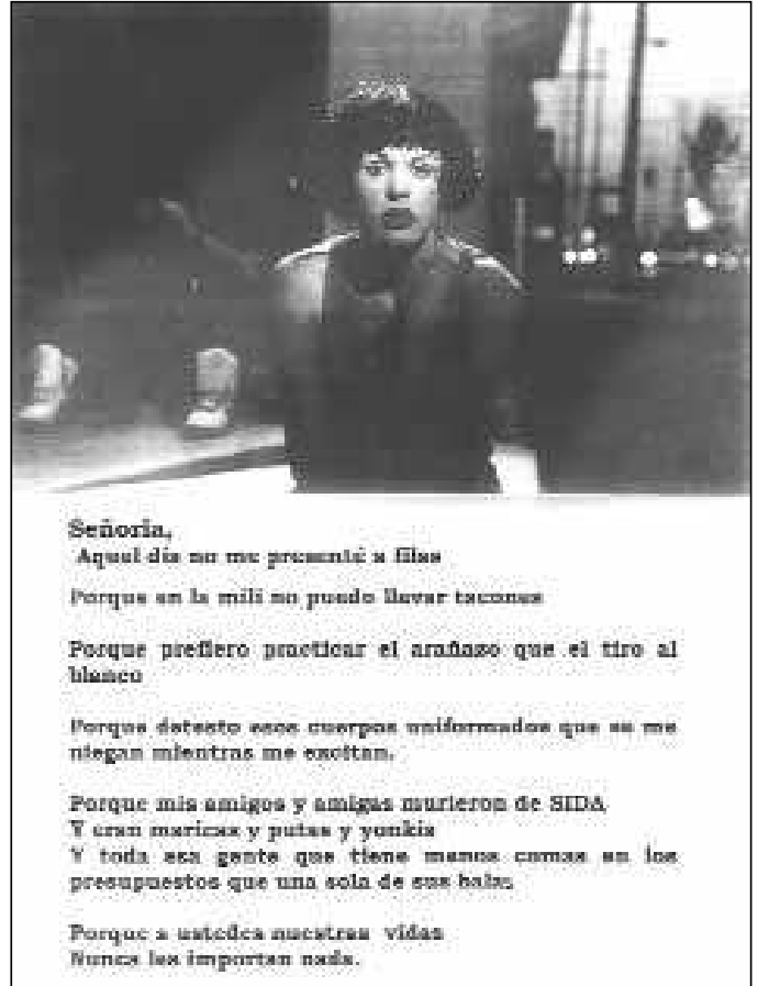
Cartel «Insumisión marica», EGHAM, Bilbao, 1995.

Señoría, Aquel día me me presenté a filas Porque en la mili no puede llevar tacónes Porque prefiero practicar el arañazo que el tiro al blanco Porque detesto esos cuerpos uniformados que se me niegan mientras me cocttan. Porque mis amigos y amigas murieron de SIDA Y eran maricas y putas y yunkis Y toda esa gente que tiene mancos como en los presupuestos que una sola de sus balas Porque a ustedes nuestras vidas Nunca les importan nada.