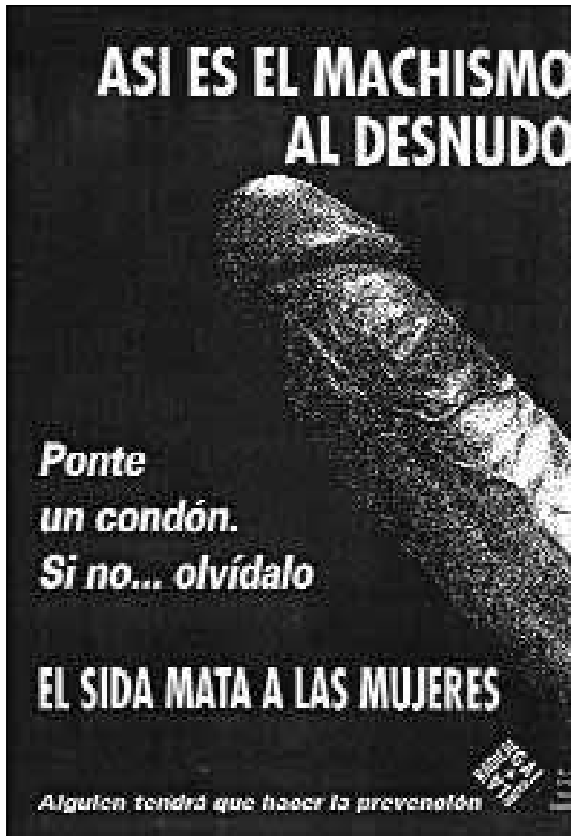
Cartel Lucha contra el SIDA, La Radical Gai, Madrid, 1994.