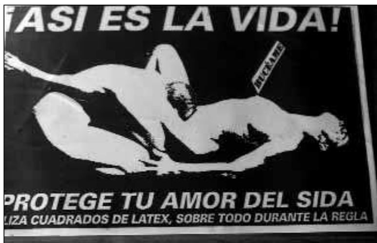
Cartel de LSD y La Radical Gai. Taller «Sexo seguro y bollero», Jornadas Feministas del Estado español, Madrid, diciembre, 1993.

Ante tanta hostilidad política y social, y ante el régimen de invisibilidad y silencio, los grupos queer resisten . Intervienen como maricas, bolleras, travestis, transexuales, etc., en su ámbito local, en los espacios y contextos políticos heterosexuales de barrios como el madrileño de Lavapiés. Defienden que la