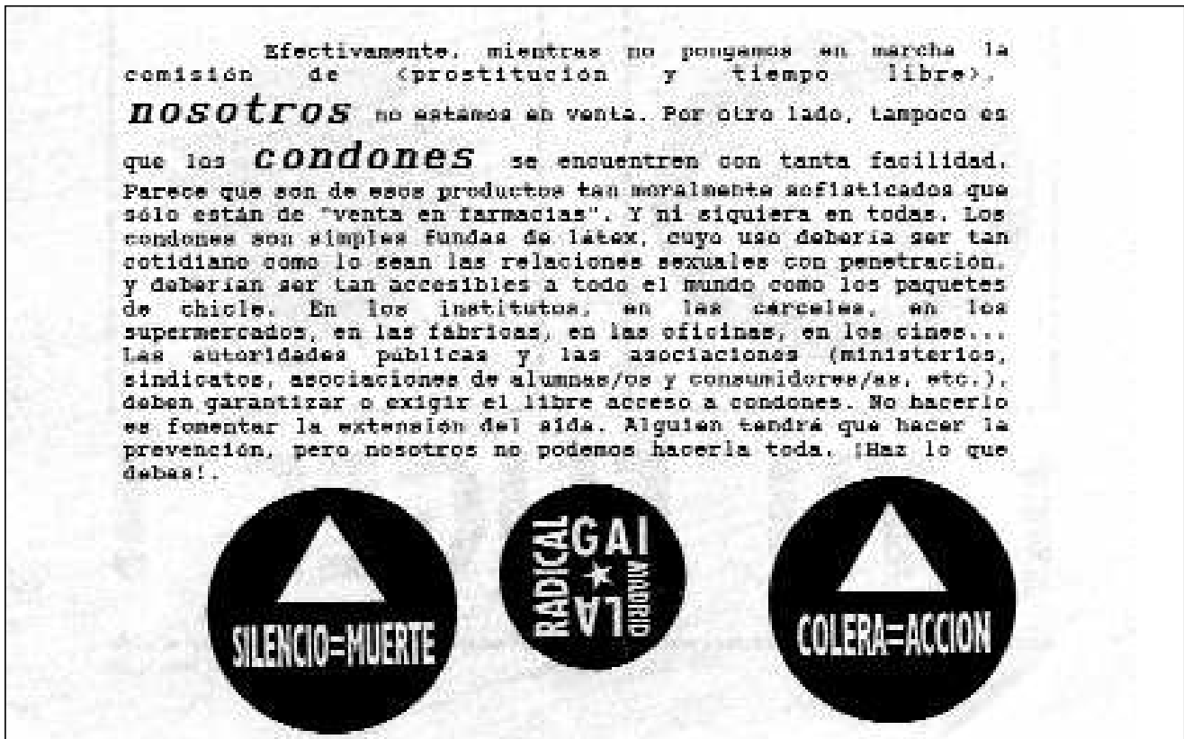
Cartel de La Radical Gai «Lucha contra el SIDA», Dossier, Madrid, 1994.

capaces de seguir manteniendo un imaginario político común, que resumen de saberes y de actos de transformación. Donde mujeres, negros, yonkis, pobres..., sean adjetivos a valorar y no sustantivos susceptibles de indiferencia.