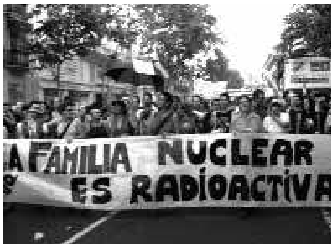
Manifestación del «orgullo», pancarta de GtQ, Madrid, 2 de julio, 2005.