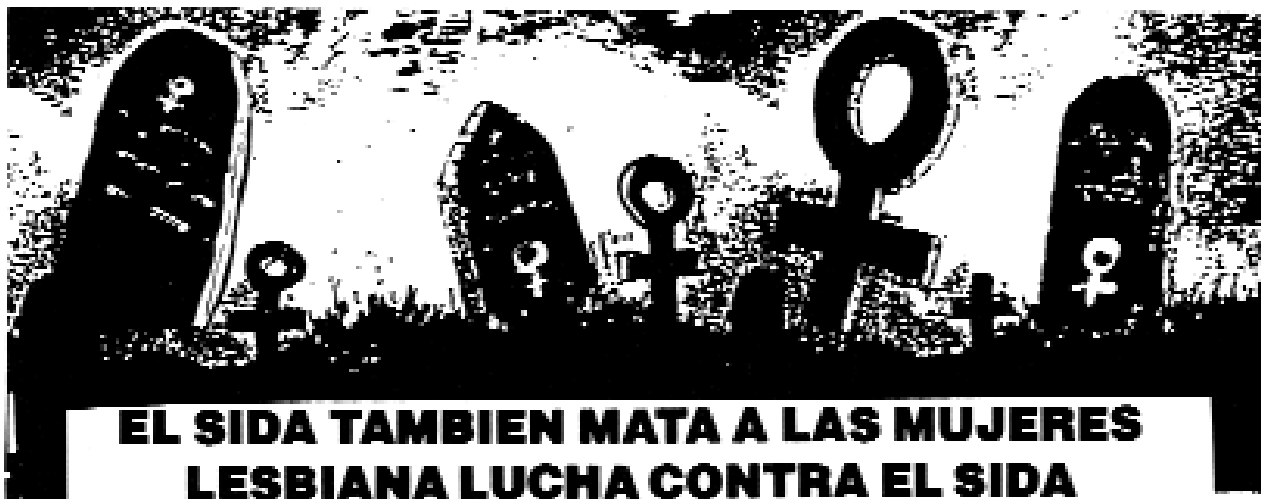
Imagen en el fanzine De un Plumazo , La Radical Gai y LSD, Madrid, 1993.