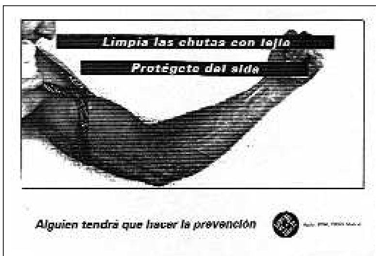
Cartel Lucha contra el SIDA, La Radical Gai, Madrid, 1994.

La ausencia o mezquindad de las políticas preventivas obligaban a los grupos de afectados a repartir condones o volantes con información sobre las formas de transmisión. La urgencia era lo que primaba PORQUE ALGUIEN TENDRÁ QUE HACER LA PREVENCIÓN. No sólo se cuestionaba la falta de campañas, sino también su contenido. No se podía hablar del SIDA sin hablar de prácticas sexuales, y hablar de estas no debía suponer ninguna valoración moral. Era necesario hablar de sexo y de su práctica, pero en primera persona y con un lenguaje claro y sin ambages.