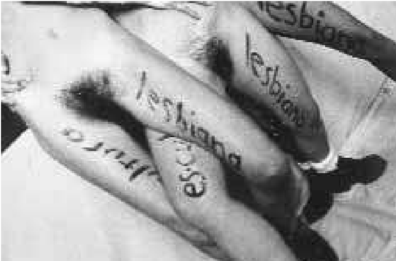
«Es-cultura Lesbiana» de la serie fotográfica «Es-cultura Lesbiana», LSD, Madrid, 1995. (Original en B/N).