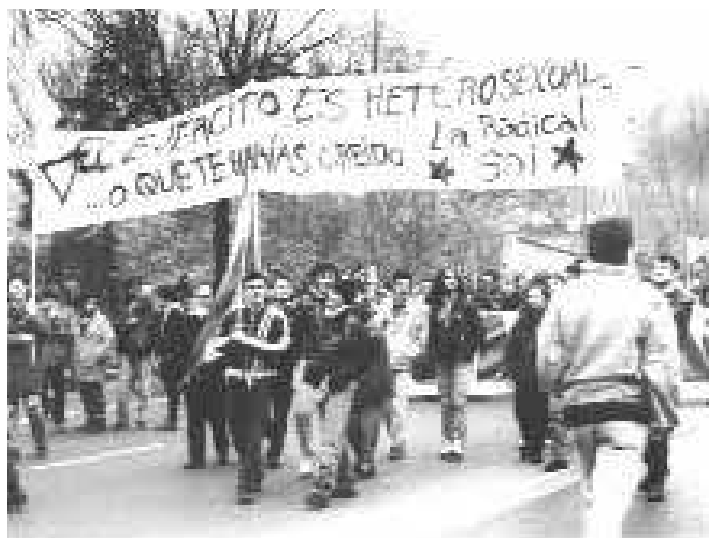
Manifestación contra el ejército y por la Insumisión. Intervención de La Radical Gai y de LSD, Madrid, 1994

movimiento de gays y lesbianas de hacer frente a la crisis del SIDA (Llamas, 1998). Grupos que surgen en Estados Unidos (y se extienden posteriormente por Europa) en los años noventa como las Lesbian Avengers , 13 ACT UP, 14 Queer Nation y las Radical Furies defienden, en momentos puntuales, la unión en la protesta de gays y lesbianas, la acción directa cargada de provocación (la estrategia in your face , en tu cara) contra la homofobia y la invisibilidad de las minorías sexuales, 15 la denuncia del silencio y de la desidia política ante el SIDA y la integración del antirracismo, el antisexismo y el anticlasismo en la protesta y la movilización. En el Estado español, surgen casi de manera contemporánea en la primera mitad de los años noventa dos de los grupos más significativos del activismo queer : LSD (Lesbianas Sin Duda) y la Radical Gai, que establecen conexiones con estos grupos en Estados Unidos, Inglaterra y Francia.