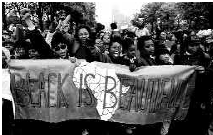
«Marcha del millón de mujeres», Filadelfia, 25 de octubre, 1997.

Madrid, primavera de 2005. En la televisión, el Telediario anuncia que se ha votado en el Congreso la ley que permite a los homosexuales casarse. La ley se ha aprobado y los primeros matrimonios se anuncian para agosto de este mismo año. Diversos pensamientos se agolpan en mi cabeza pero me resulta imposible verbalizarlos, tampoco quiero hacerlo. Unos meses antes, cuando se anunció que la proposición de ley se presentaba a trámite parlamentario mucha gente de mi entorno se fue a celebrarlo a Chueca. Yo no. Durante un par de semanas, al menos, estuve recibiendo felicitaciones de familiares y amigos: «Ya te puedes casar, ya sois iguales».