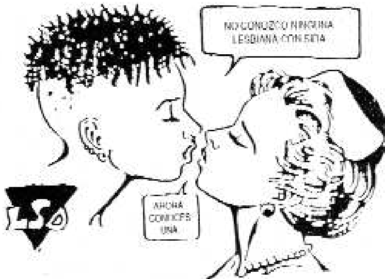
Fanzine Non-Grata, LSD, Madrid, 1994.

políticos y famosos se hacían fotos y demostraban su solidaridad frente a las cámaras. LSD y La Radical sacaron pitos y banderas a la calle, remedando las acciones de otros grupos en el extranjero, se pintaban siluetas en el suelo con las siglas VIH, se teñía de rojo la fuente de la plaza o siguiendo tradiciones más ibéricas, se imprecaba, escupía y se pretendía amedrentar con rabia a los jóvenes de la secta papista que con cara de martirio se protegían tras sus carteles de «La castidad es la solución».