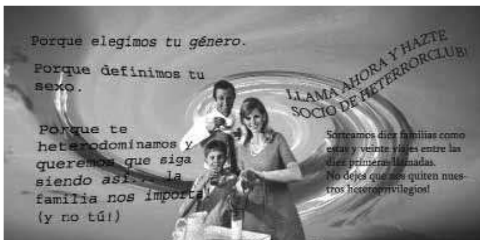
Flyer-GtQ, Junio, 2005. Intervención contra la manifestación homófoba que tuvo lugar en Madrid el 18 de junio de 2005 bajo el lema «la familia importa». (Original en color).