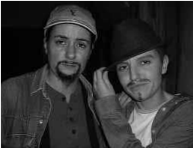
Fiesta-taller Drag-king , «Noche de reyes», GtQ, Escalera Karakola, Madrid, 5 de enero, 2004.