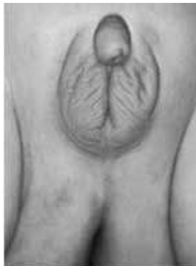
Imagen número 6: Intersexualidad. Pescada en la red.

6 De la 1 a la 5: Atlas of congenital anomalies of the external genitalia . http://www.atlasperovic.com