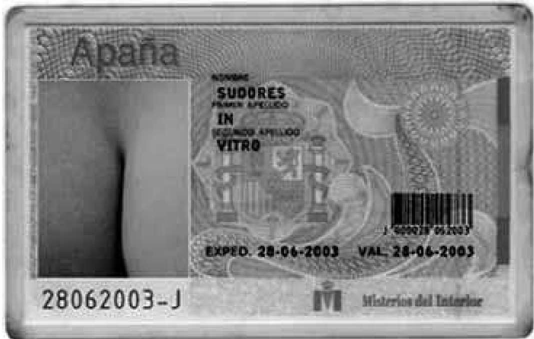
Cartel de GTQ «Alteración del DNI», manifestación del «orgullo», Madrid, 2004.