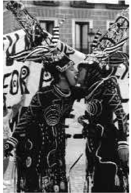
Intervención de LSD. Manifestación del 8 de Marzo. Madrid, 1995.