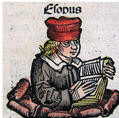
Esopo. Ilustración en las Crónicas de Núremberg .

La fábula es una composición literaria narrativa breve, generalmente en prosa o en verso , en la que los personajes principales suelen ser animales o cosas inanimadas que hablan y actúan como seres humanos. Cada fábula cuenta, en estilo llano, una sola y breve historia o anécdota que alberga una consecuencia aleccionadora. Posee "una intención y redacción didáctica de carácter ético y universal" 1 que casi siempre aparece al final y más raramente al principio, llamada generalmente moraleja o adfabulación . En el Diccionario de retórica y poética de Helena Beristáin 2 se indica que “se trata de un género didáctico mediante el cual suele hacerse crítica de las costumbres y de los vicios locales o nacionales, pero también de las características universales de la naturaleza humana en general”.