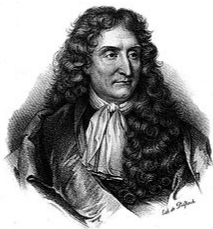
Jean de La Fontaine .

Durante el Renacimiento las fábulas contaron con el interés de los humanistas ; Leonardo da Vinci , por ejemplo, compuso un libro de fábulas. El género de los emblemas , que se puso de moda en el siglo XVI y XVII, recurrió con frecuencia a la fábula en el comentario escrito y en el grabado gráfico a imitación del humanista italiano Alciato , como los de Guillaume Guéroult , quien parece haberse especializado en este género con Le Blason des Oyseaux (1551), Les Hymnes du Temps et de ses parties (1560) y Les Figures de la Bible (1564), compuestos bajo el mismo modelo de un grabado acompañado de una corta pieza en verso. En Portugal cultiva la fábula Sá de Miranda . El jesuita François-Joseph Desbillons , profesor, produjo quinientas sesenta. Boisard publicó una colección con mil y una. Jean-Pons-Guillaume Viennet publicó en 1843 fábulas que escribió a lo largo de toda su vida. Incluso Napoleón , antes de ser consagrado emperador, compuso una juzgada bastante buena en su época.