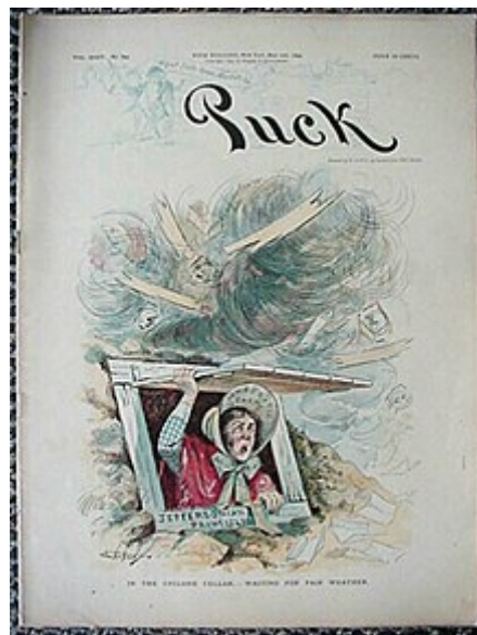
Caricatura política aparecida en la revista estadounidense Puck en 1894 del ilustrador S.D. Ehrhart en la que se muestra a una campesina, de nombre "Partido Demócrata", que se refugia de un tornado de cambio político .

El término es importante tanto en teoría literaria (En la retórica tradicional donde define a un tropo de dicción, y también en estudios recientes que la ubican como elemento fundamental para entender el discurso narrativo bajo una perspectiva hermenéutica y fenomenológica ); y en lingüística (donde es una de las principales causas de cambio semántico ).