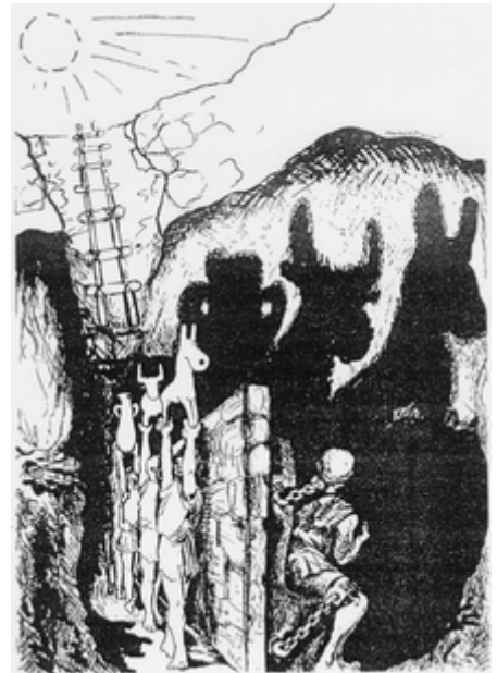
La "Alegoría de la caverna" de Platón, por Markus Maurer

La parábola y la alegoría suelen ser tratadas como sinónimos , pero fueron bien diferenciadas por H.W. Fowler en Modern English Usage (Uso moderno del inglés): "El objeto en cada una es iluminar al oyente presentándole un caso en el que aparentemente no estaba interesado, y sobre el cual deberá obtener un juicio desinteresado de su parte". Provoca, en otras palabras, que el lector u oyente caiga en la cuenta de que la conclusión se aplica bien de igual forma a sus propias preocupaciones. La parábola, sin embargo, es más condensada que la alegoría: un solo principio viene a portar, del que se deducirá una sola moral.