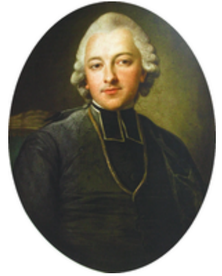
Ignacy Krasicki .