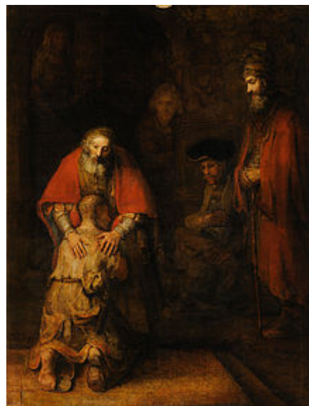
El retorno del hijo pródigo (c. 1662), obra de Rembrandt inspirada en la parábola del hijo pródigo que el Evangelio de Lucas atribuye a Jesús de Nazaret .

La parábola tiene un fin didáctico y podemos encontrar un ejemplo de ella en los evangelios cristianos, donde Jesús narra muchas parábolas como enseñanzas al pueblo.